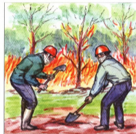
Забрасывание огня рыхлым грунтом повышает эффективность борьбы с пожаром