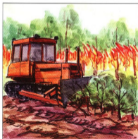
Для прекращения распространения огня следует устраивать земляные полосы