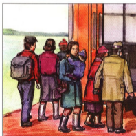
При приближении огня к населённому пункту жителей необходимо эвакуировать