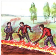
Захлестывание крошки пожара — самый простой и достаточно эффективный способ тушения