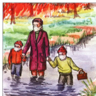
В экстремальных случаях выходить придётся не только по дорогам, а чаще вдоль рек, ручьёв и непосредственно по воде